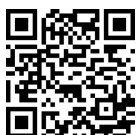
K120 3D demo