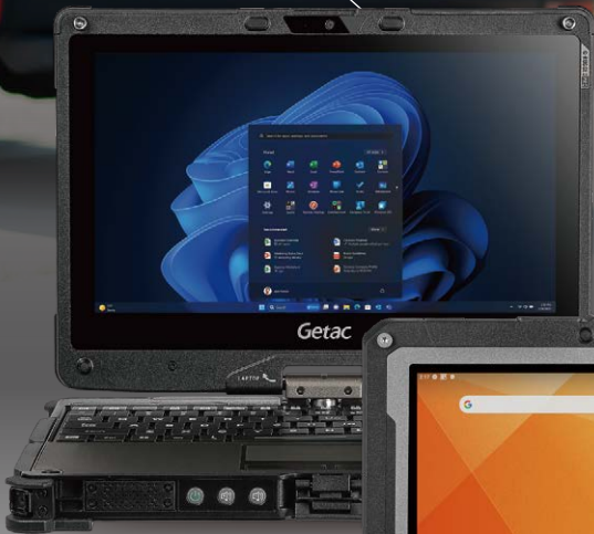
Getac F110 - 11.6" 显示屏 - Windows操作系统