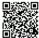
B360 3D demo